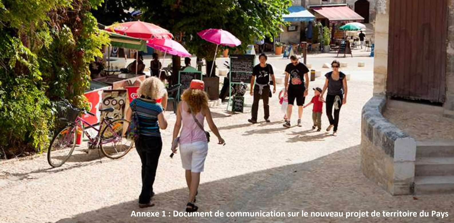
Annexe 1 : Document de communication sur le nouveau projet de territoire du Pays